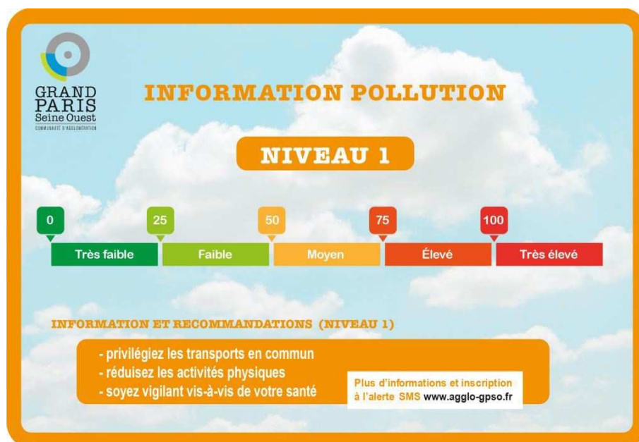
Pièce jointe explicative lors d'alerte pollution

Pour en savoir plus vous pouvez contacter : sophie.charvet@seineouest.fr et consulter la rubrique : http://www.seineouest.fr/air.html