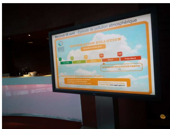
Information diffusée dans les halls d'entreprises (ici : BNP Paribas)